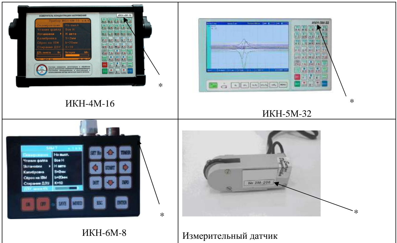
Рисунок 1 - Общий вид модификаций приборов.