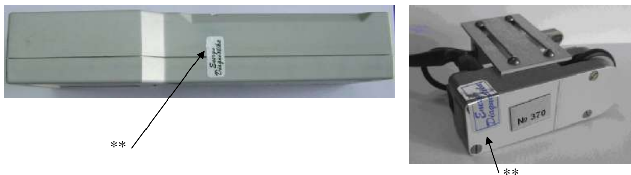
Рисунок 2 – Схема пломбирования от несанкционированного доступа измерителя концентрации напряжений ИКН (на примере ИКН-3М-12) и измерительного датчика.

Схема пломбирования от несанкционированного доступа (на примере модификации ИКН-3М-12) представлена на рисунке 2.