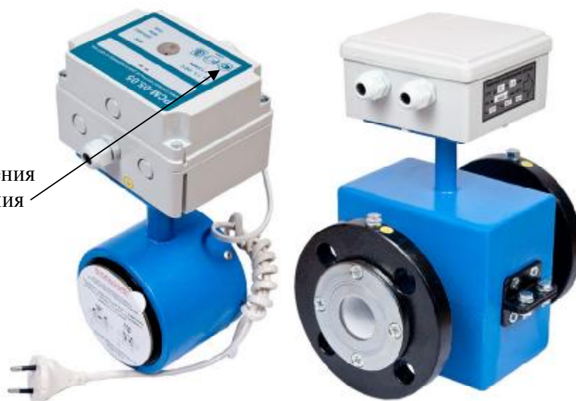
Рисунок 2 - Внешний вид РСМ-05.05 и РСМ-05.05С, РСМ - 05.05СМ, РСМ-05.07, РСМ - 05.07М

Место для нанесения знака утверждения типа