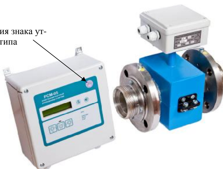
Рисунок 1 - Внешний вид РСМ-05.03 и РСМ - 05.03С, РСМ - 05.03СМ

Место для нанесения знака утверждения типа