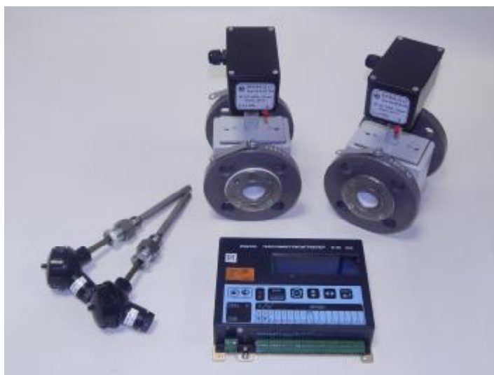
Рисунок 1 – Общий вид теплосчетчиков ИМ2300Т