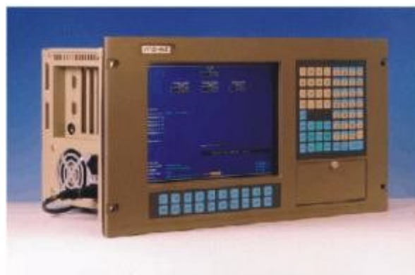
Рисунок 3. Индустриальный компьютер UPC 500 P