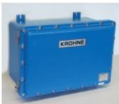
Рисунок 2. Промежуточный преобразователь UFC 500 F-EEh или UFC 5 в защитной коробке