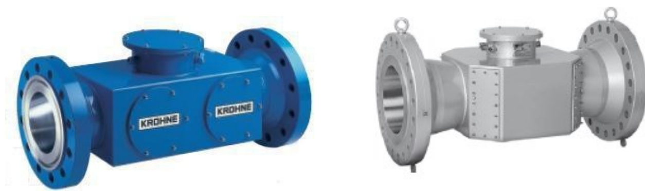
Рисунок 1. Первичный преобразователь UFS 500 F-EEh