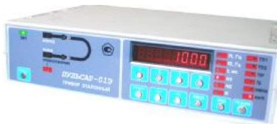
Рисунок 1 – Внешний вид приборов

Внешний вид и схема пломбирования приборов приведены на рисунках 1 и 2 соответственно.