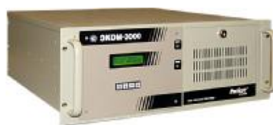
Рисунок 2 – Исполнение R