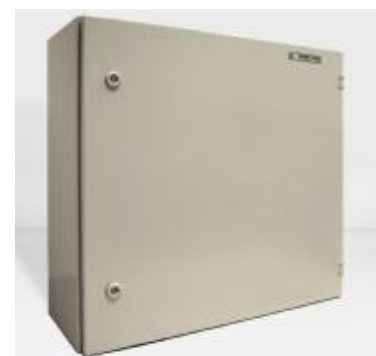
Рисунок 3 – Исполнение S

В общем случае УСПД ЭКОМ-3000 состоит из: