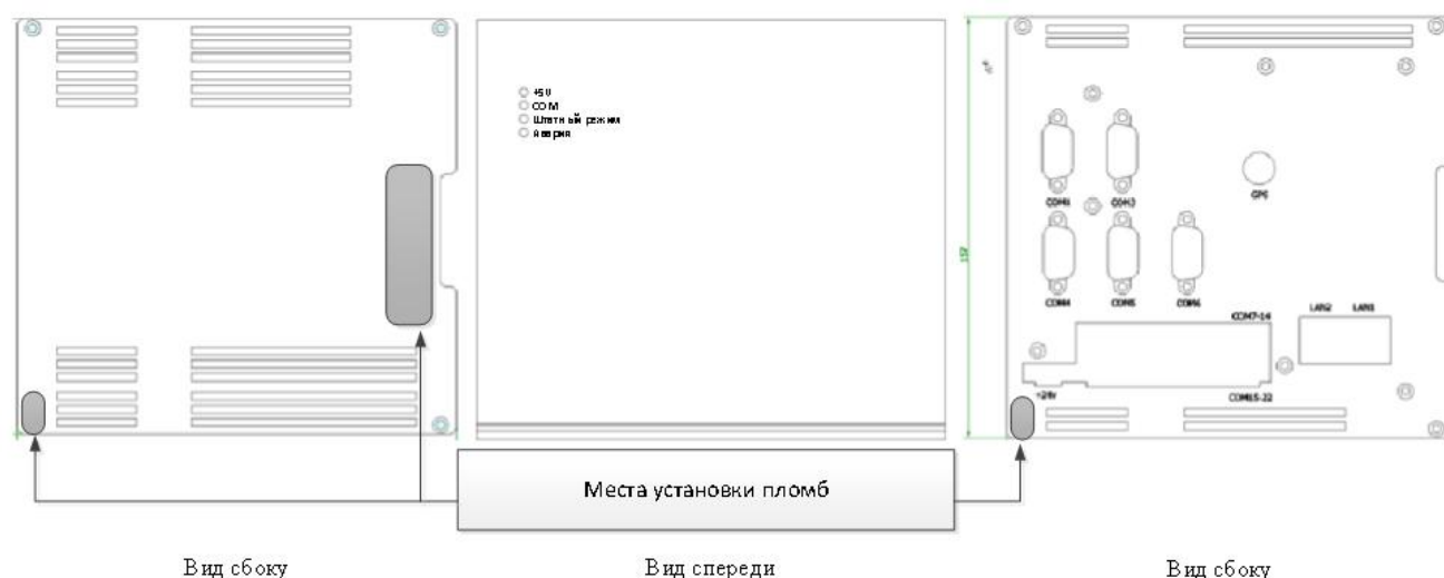
Рисунок 4 – Общий вид и места пломбирования УСПД «ЭКОМ-3000» исполнения Т

На рисунках 4-6 указаны места пломбирования УСПД «ЭКОМ-3000» в зависимости от исполнения.