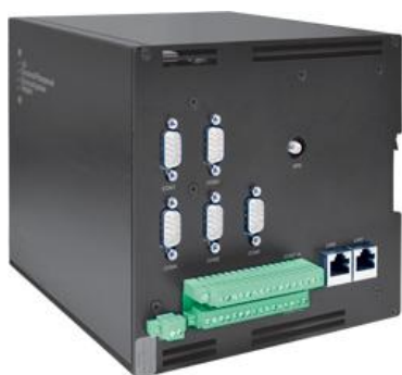
Рисунок 1 – Исполнение Т