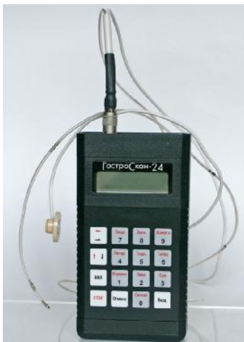
Рис. 1. Общий вид ацидогастромонитора

Схема пломбировки ацидогастромонитора от несанкционированного доступа изображена на рис. 2.