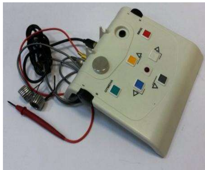
Рисунок 3 – Пульт испытуемого.

Общий вид комплекса диагностического универсального УПДК-МК для видов исполнений НКРМ.466961.001-02, НКРМ.466961.001-02.01, НКРМ.466961.001-02.02 и схема маркировки представлены на рисунках 3 – 4.