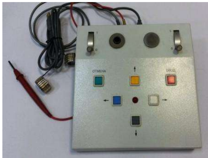
Рисунок 1 – Общий вид пульта испытуемого.

Общий вид комплекса диагностического универсального УПДК-МК для видов исполнений НКРМ.466961.001, НКРМ.466961.001-00.01, НКРМ.466961.001-00.02 и схема маркировки представлены на рисунках 1 – 2.