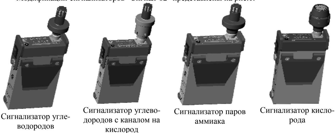
Рис.1. Модификации сигнализаторов "Сигнал-02".

Модификации сигнализаторов "Сигнал-02" представлены на рис.1.