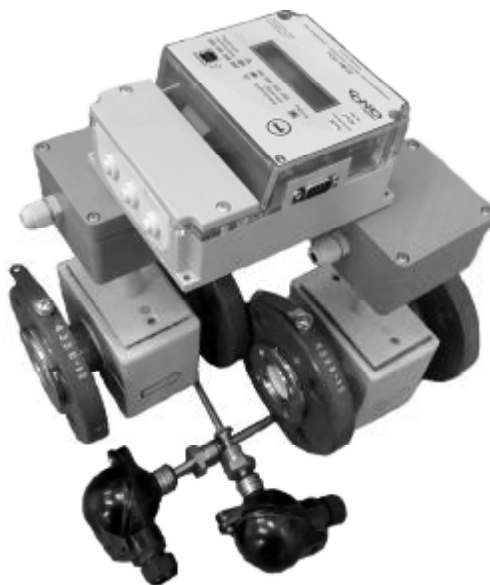
Рисунок 1 – Общий вид теплосчётчиков

Теплосчётчики осуществляют следующие функциональные возможности: