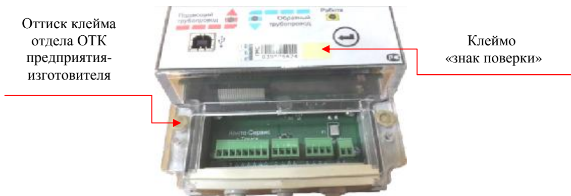
Рисунок 2 – Места пломбирования

Защита от внесения несанкционированных изменений в ВИБ теплосчётчиков обеспечивается посредством нанесения оттиска клейма предприятия-изготовителя на мастику в чашечках согласно рисунку 2 и знака поверки на корпусе ВИБ.