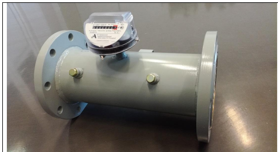
Рисунок 2- Внешний вид счетчика без масляного насоса