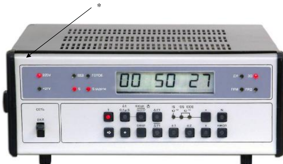
Рисунок 1 – Внешний вид компаратора ЧК7-51

Внешний вид компаратора ЧК7-51 и место нанесения Знака утверждения типа приведены на рисунке 1. Схема опломбирования компаратора ЧК7-51 приведена на рисунке 2.