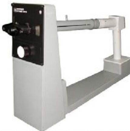
Рисунок 1. Общий вид поляриметра кругового СМ-3

Фотография общего вида поляриметра представлена на рис. 1. Схема пломбировки поляриметра от несанкционированного доступа изображена на рис. 2.