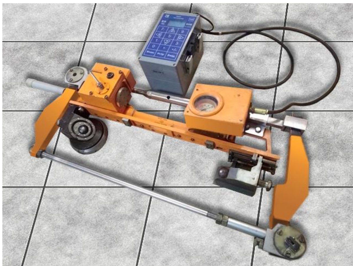
Рисунок 1 – Общий вид средства измерений