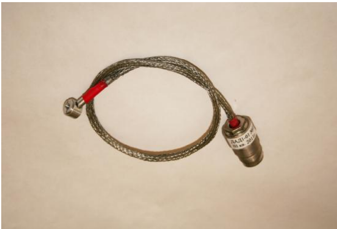
Рисунок 3 – Внешний вид детектора ДАД1-01

Внешний вид детектора ДАД1-01 приведен на рисунке 3.