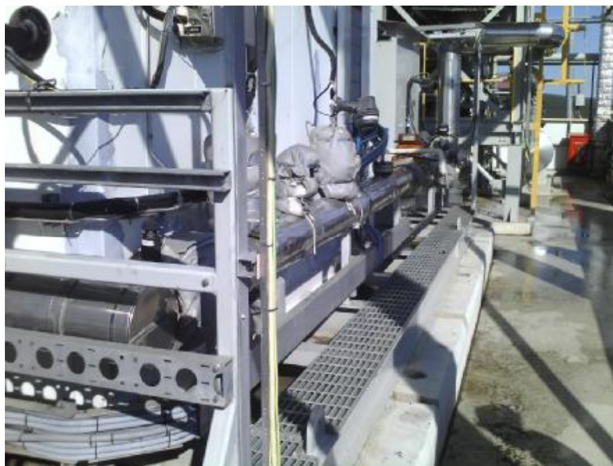
Рисунок 2. Внешний вид измерительного трубопровода