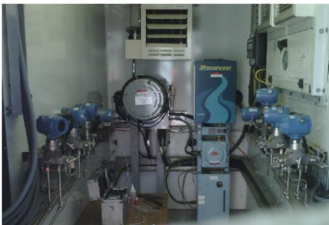
Рисунок 3. Фотография средств измерений, расположенных в теплоизолированном боксе